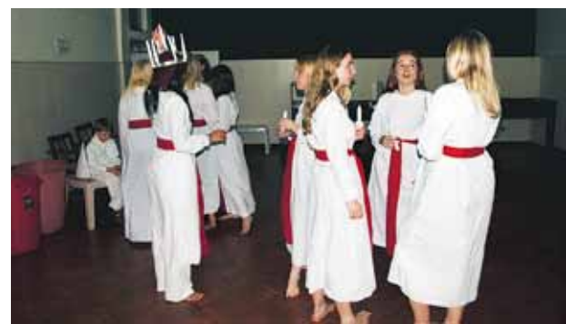
Svenskt Luciatåg i Indien!

Konserten var två hela timmar lång men jag kan lova att de två timmarna kändes som 30 minuter. Det var så underbart att få sjunga tillsammans med de här barnen och få dela den glädjen som sången för med sig. Det bästa var att sjunga tillsammans med barnen från Meher-hemmet,