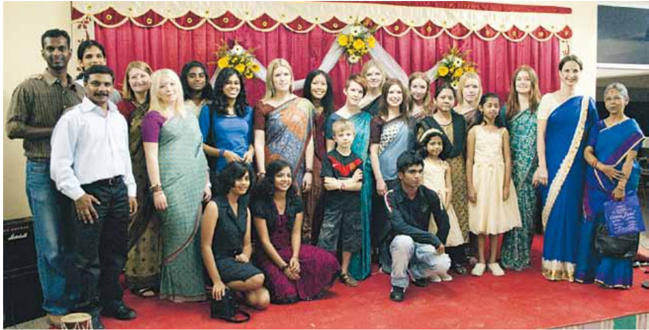
Några av de medverkande på konsertkvällen på Cosmopolitan Club.