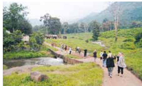
Fantastisk natur i Nationalparken.