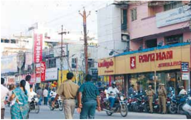
Gatubild från staden Coimbatore.